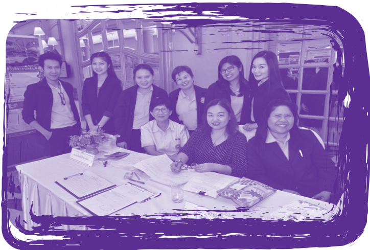
ทีมงานผู้จัดการประชุมเชิงปฏิบัติการ เรื่อง พลังสู่ความสำเร็จของการพัฒนาคลินิกโรค จากการทำงาน