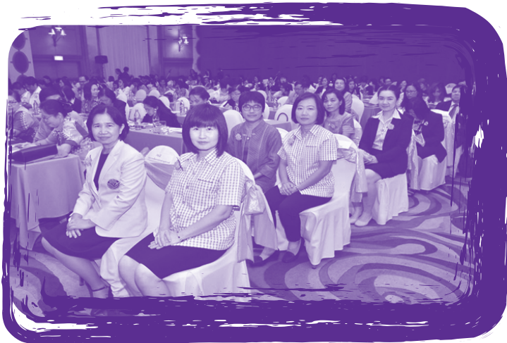
ผู้เข้าร่วมประชุมเชิงปฏิบัติการ เรื่อง พลังสู่ความสำเร็จของการพัฒนาคลินิกโรคจากการทำงาน