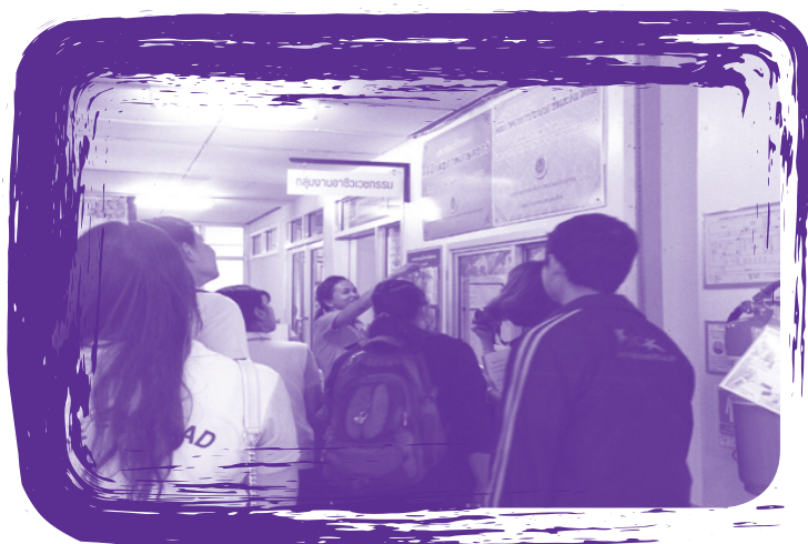
การนิเทศติดตามโครงการพัฒนาคลินิกโรคจากการทำงาน