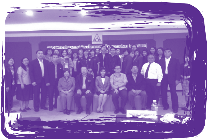
การประชุมตรวจติดตามผลการดำเนินงานคลินิกโรคจากการทำงานรายภาค ประจำปี 2559 จังหวัดชลบุรี จัดโดยสำนักงานประกันสังคม