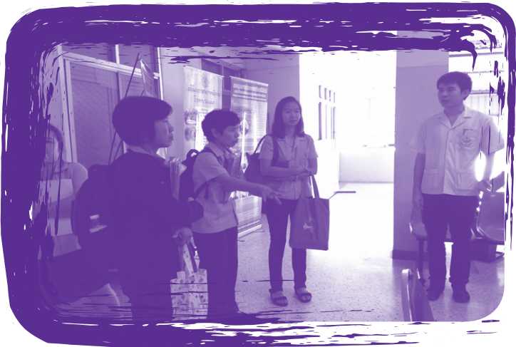
การนิเทศติดตามโครงการพัฒนาคลินิกโรคจากการทำงาน