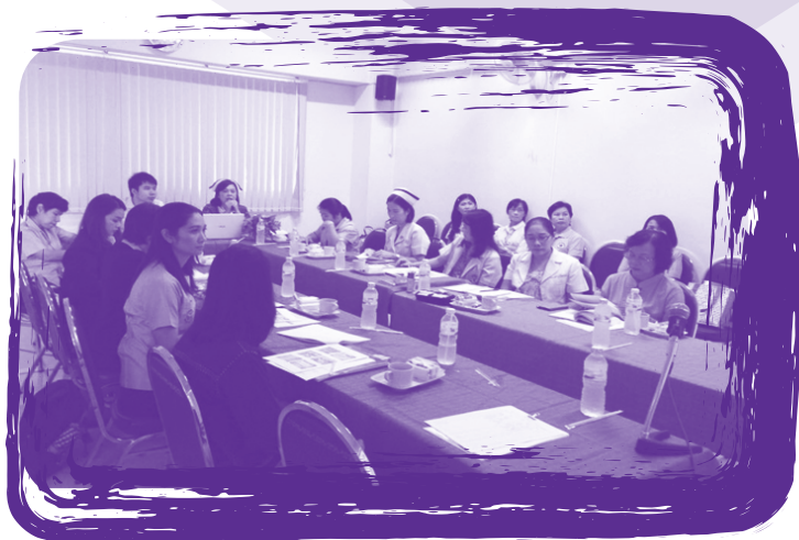
การนิเทศติดตามโครงการพัฒนาคลินิกโรคจากการทำงาน