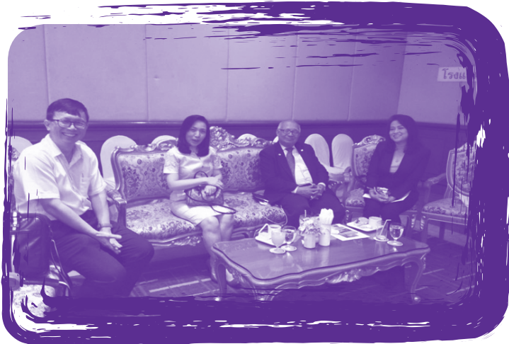
การประชุมชี้แจงผลการดำเนินงานโครงการพัฒนาคลินิกโรค จากการทำงาน