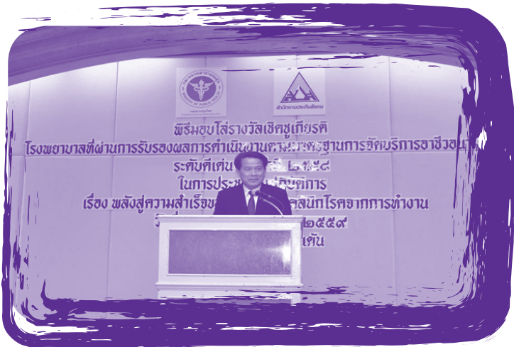
นายแพทย์อานวย กาจิ่นะ อธิบดีกรมควบคุมโรค ให้เกียรติมาเป็นประธาน เปิดการประชุมเชิงปฏิบัติการ เรื่อง พลังสู่ความสำเร็จของการพัฒนาคลินิกโรคจากการทำงาน วันที่ 24 -26 สิงหาคม 2559 ณ โรงแรมมารวยการ์เด็น กรุงเทพฯ