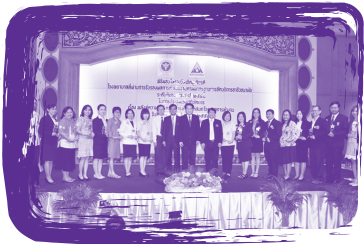
พิธีมอบโล่รางวัลเชิดชูเกียรติ โรงพยาบาลที่ผ่านการรับรองผลการดำเนินงาน ตามมาตรฐานการจัดอาชีวอนามัยระดับดีเด่น วันที่ 24 -26 สิงหาคม 2559 ณ โรงแรมมารวยการ์เด็น กรุงเทพฯ