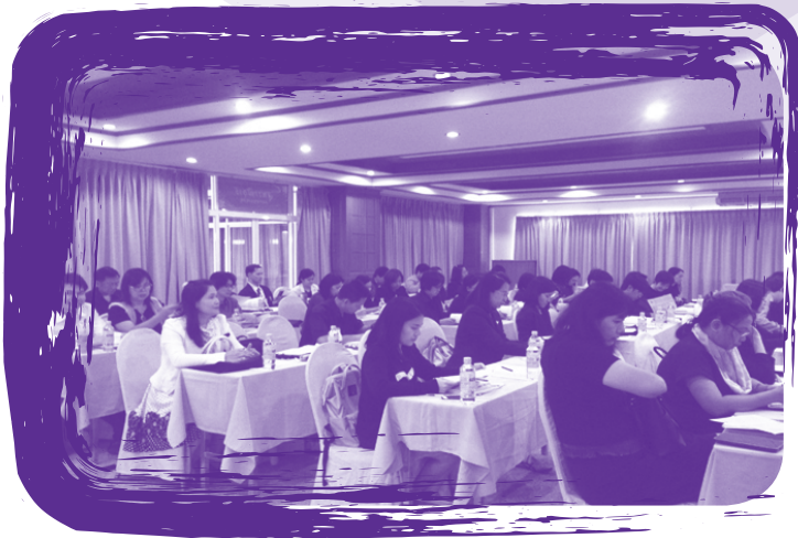
การประชุมตรวจติดตามผลการดำเนินงานคลินิกโรคจากการทำงานรายภาค ประจำปี 2559 จังหวัดอุบลราชธานี จัดโดยสำนักงานประกันสังคม