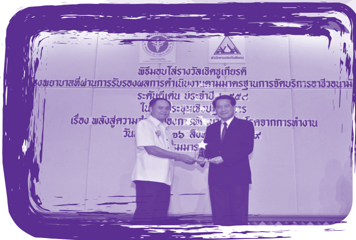
ผู้แทนจากโรงพยาบาล รับลือห์รางวัล เป็นโรงพยาบาลที่ผ่านการรับรองผลการดำเนินงานตามมาตรฐานการให้บริการอาชีวอนามัยระดับดีเด่น ประจำปี 2558