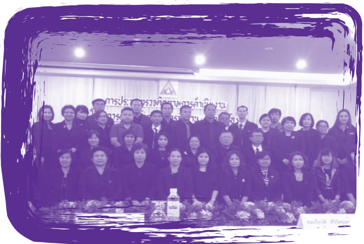
การประชุมตรวจติดตามผลการดำเนินงานคลินิกโรคจากการทำงานรายภาค ประจำปี 2559 จังหวัดอุบลราชธานี จัดโดยสำนักงานประกันสังคม