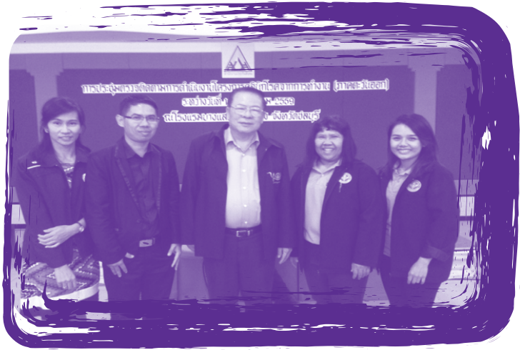
การประชุมติดตามผลการดำเนินงานคลินิกโรคจากการทำงานรายภาค ประจำปี 2559 จังหวัดชลบุรี จัดโดยสำนักงานประกันสังคม