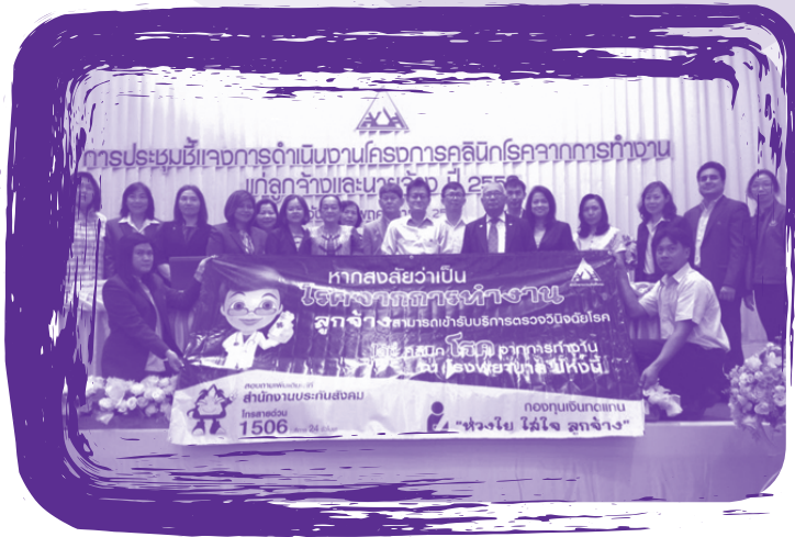
การประชุมชี้แจงผลการดำเนินงานโครงการพัฒนาคลินิกโรค จากการทำงาน